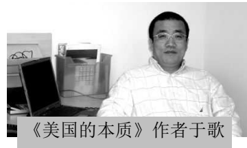
《美国的本质》作者于歌