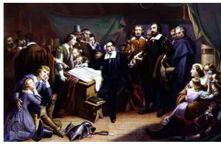
一批清教徒在五月花号签署「五月花号公约」，其宗教性成为美国的立国之本

第一至二章是作者的基本立论，阐明美国的主流价值观源自基督新教。在第一章中，作者先陈述美国表面上有一般世俗化国家的特征：政教分离、信仰自由及追求物质享受。很多人都以为美国的基督教已经衰落，但是实质上，美国是一个十分宗教化的国家，从美国民众、社会、经济、政府及政党等的宗教性现象均