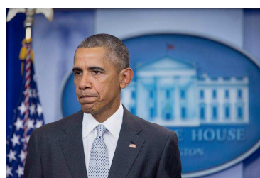
2015年11月13日恐怖组织IS袭击巴黎七地点，奥巴马响应IS的行动不单是针对法国，更是对人权和普世价值的威胁，美国理念外交特色表露无遗。

在第四章中，作者说明上述这种理念外交实际上是基督教理念的产物，原来美国外交所持守的意识形态，都在基督教信仰中有迹可寻。基督教强调神造的每个人都是尊贵的，人是这个世界的目的，人应有自由和空间去发挥自身才能，任何制度都应为实现人的权利而设，