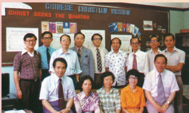
1976年中信美港菲台各地同工聚於香港

我們敬愛的中國信徒佈道會創辦人王永信牧師已於 2018 年 1 月 4 日清晨 8 時 56 分（美國西岸時間），息去地上勞苦，榮歸天家。