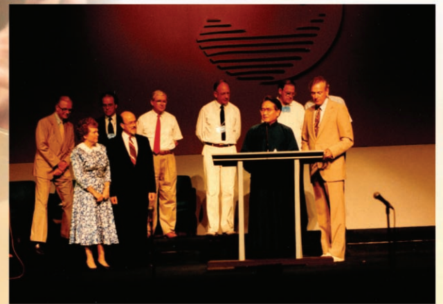
1989年第二屆 洛桑大會