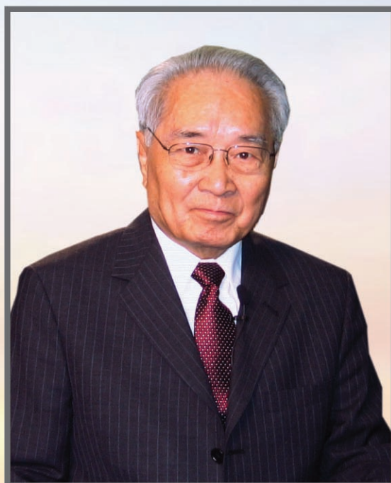
王永信牧師 1925 - 2018