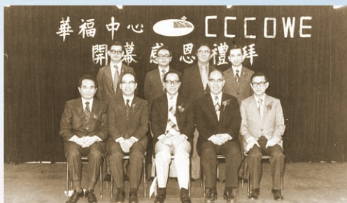
1976年華福中心開幕禮