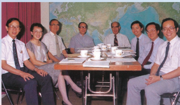
1986年華福董事會主席與常委會

王牧師是神重用的忠僕，早在 1974 的洛桑會議，他連同約 70 位華人教會領袖在會議中，同感領受了向華人教會推動福音遍傳運動，兩年後即 1976 年 8 月舉行首屆華福大會，並於同年成立華福中心，他更受邀