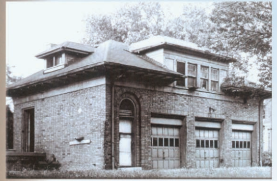
中信開創時期的 底特律車房