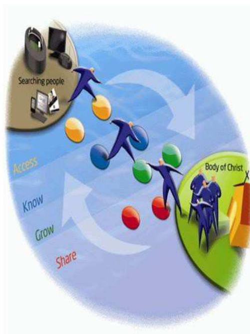
图五 — 将网友带入基督的身体