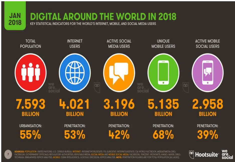
图4 — 全球人口网络使用者