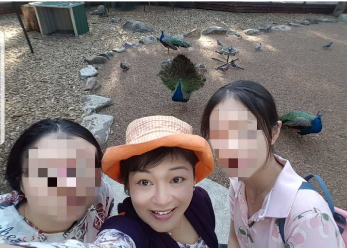
三只开屏的孔雀在四下转身展示美丽