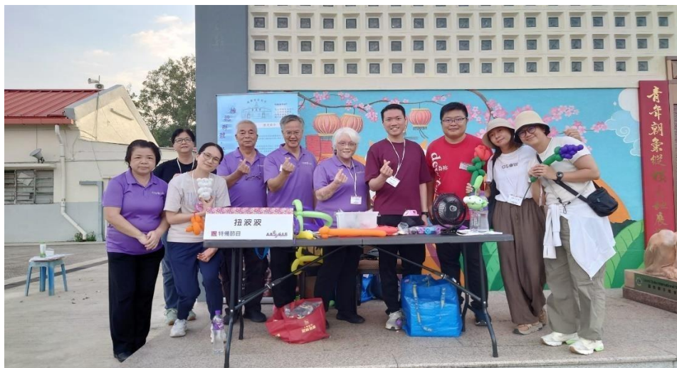
图 11. 崇真会南华莆堂牧者及会友参与第一届客家福音节

2024 年，此机构更以探访客家地区为名，与中国国内的客家福音团体合作举办国内客家地区访宣团，逐步开展对国内客家地区的差传工作。