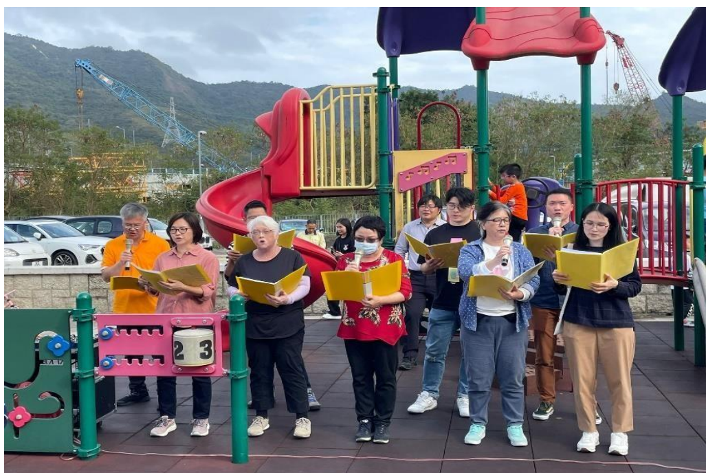
图 14 教会诗班在丁酒节目中献唱圣诗