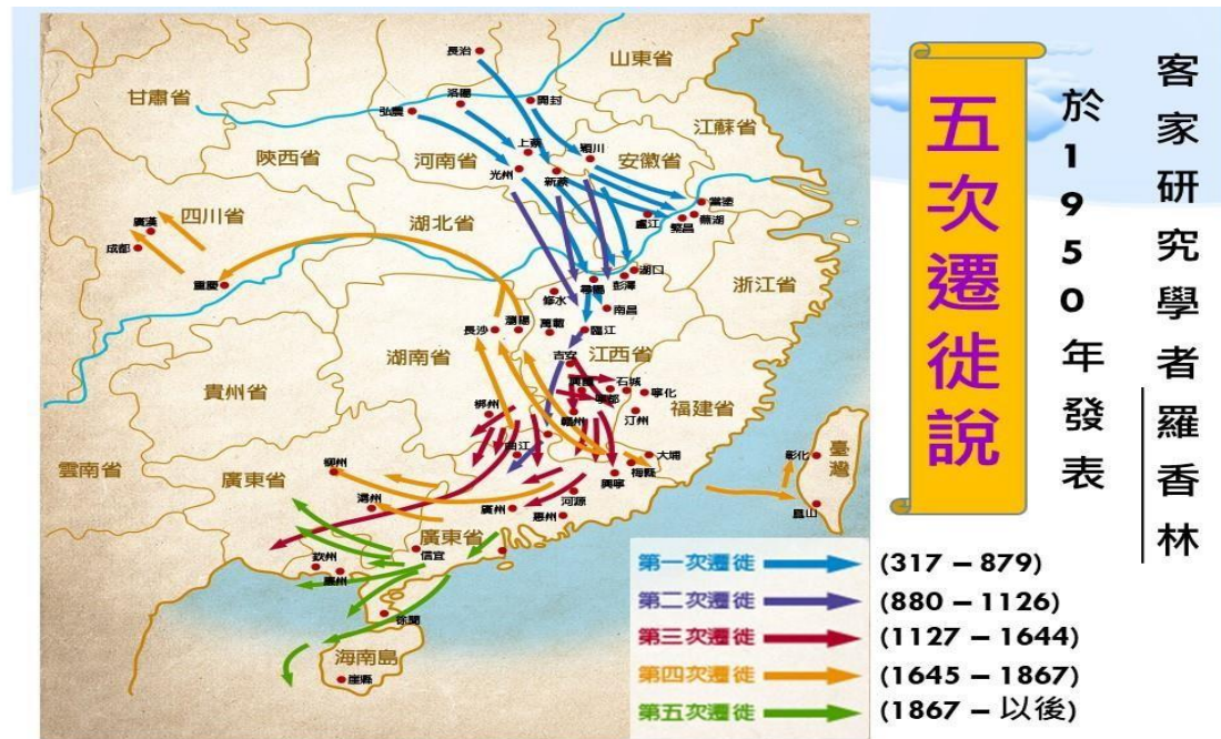
图 4. 客家族群五次迁徙说

客家族群乃是中国各民族中，最擅于迁徙的族裔，在中国各地以至海外均能见其踪影，有着其独有的客家语言及饮食文化。当笔者仔细研究罗香林所提出的客家民族五次迁徙说时，发现其五次迁徙之年份均为中国各朝代中处于动荡、战乱之时期。