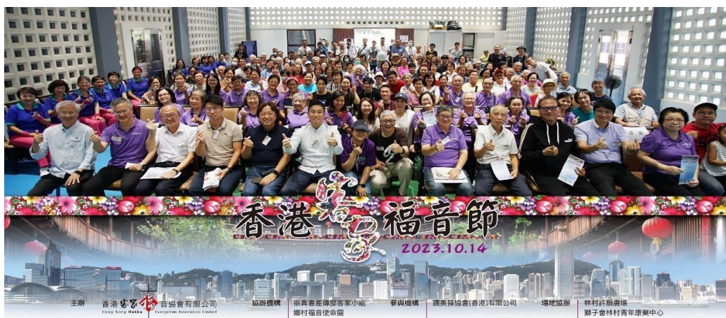
图 10. 第一届香港客家福音节

该会以积极发展客家诗班及发扬客家文化的方式，致力把基督信仰与现今世代的本地客家文化互相融合，以达致本色化的差传方式。在 2023 年，该会首次于林村广场举办客家福音节。这福音活动亦邀得崇真会崇谦堂及崇真会南华莆堂一同参与。至此，南华莆村的信仰气息亦成熟至可与其福音源头一同合作，成就更大的差传工作。