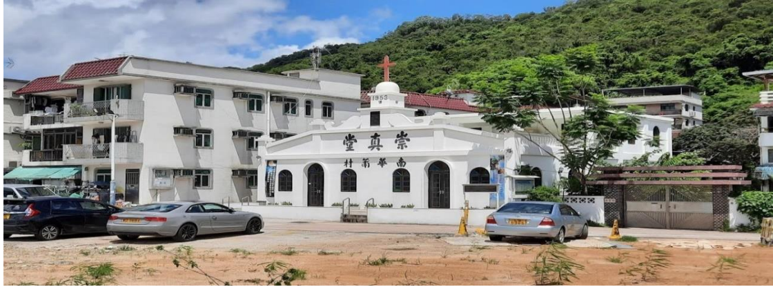
图 2.崇真会南华莆堂现貌(2006 年因白蚁侵蚀而重建)