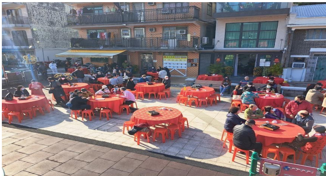
图 13. 丁酒盘菜宴