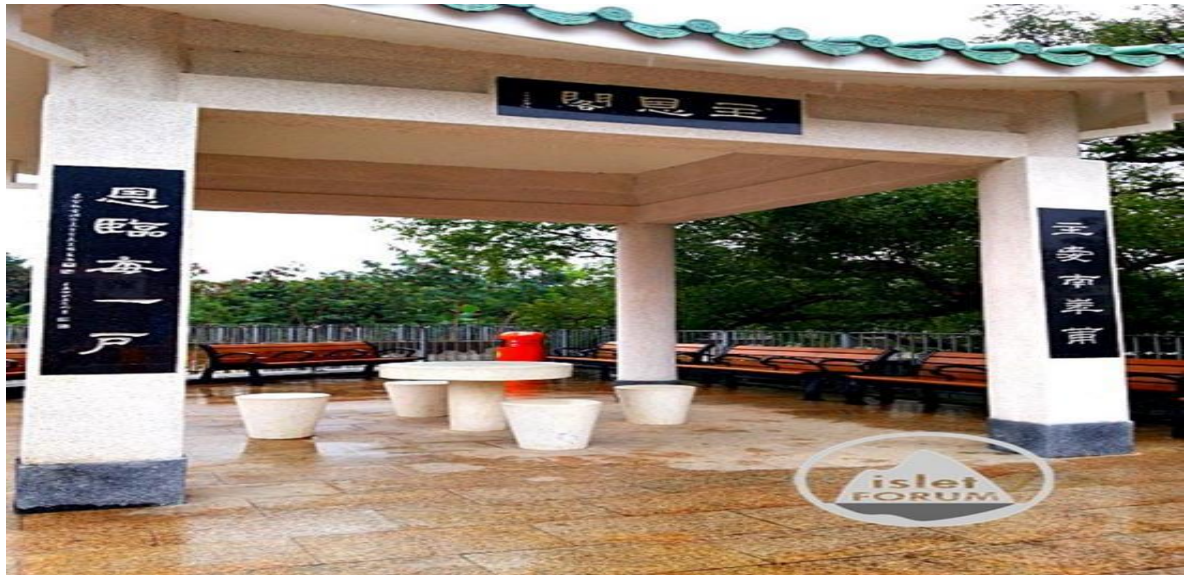
图 12. 村中的建筑[主恩阁]

了一所[主恩阁]作为村民休憩之用。由此可见，村民在建筑村中的硬件配套时，处处渗透着基督化的气息，除了显示出村民对基督氛围的重视，也让迁入居住或前来到访的人，感受到此村落对基督信仰的推崇备至。