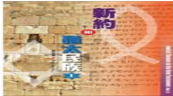
新約和猶太民族（上）