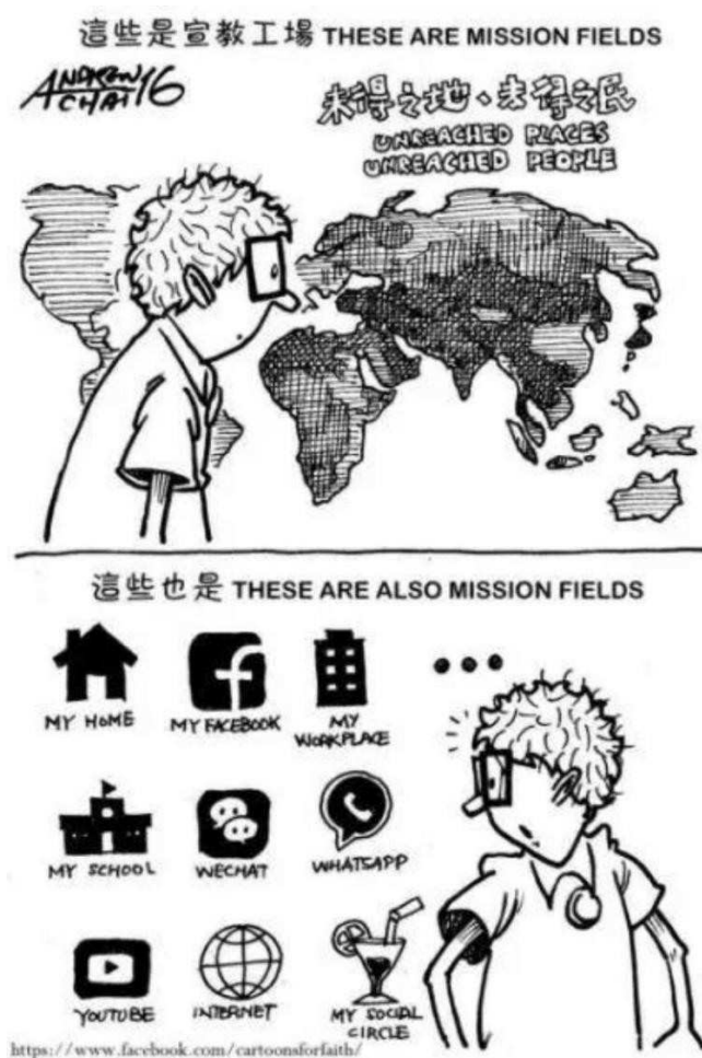
圖六一 網絡宣教: 贏得網絡上的未得之民