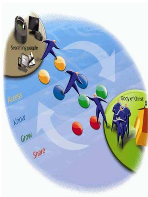
圖五 — 將網友帶入基督的身體