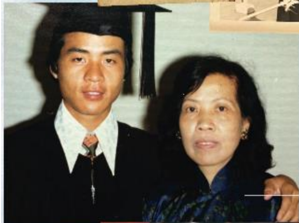
1976年「中大」畢業 與母親合照