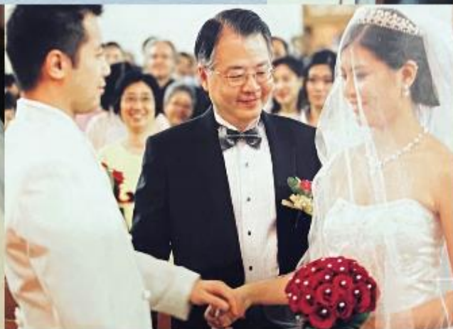
2010年8月28日 大女兒婚後出閣