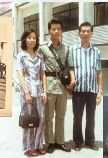
1977年警校畢業與父母合照