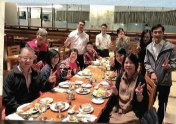
最喜愛與家人、門生及 好友們享用自助餐