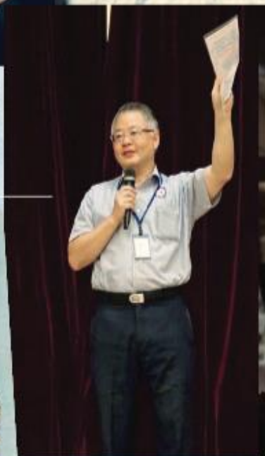
約40多年前的潮流型男 「飛仔傑」也！