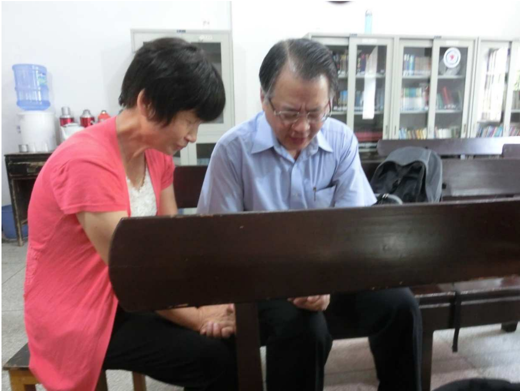
在國內為需要者禱告服侍