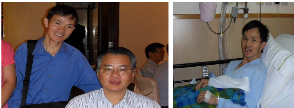
患有心臟病的傳道與連牧師